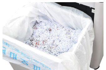
규격: 소형 | 크기: 650X550mm